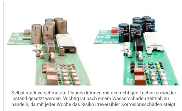
Selbst stark verschmutzte Platinen können mit den richtigen Techniken wieder instand gesetzt werden. Wichtig ist nach einem Wasserschaden zeitnah zu handeln, da mit jeder Woche das Risiko irreversibler Korrosionsschäden steigt.

Generell gilt: Zögern Sie nach einem Wasserschaden nicht zu lange. Wir unterstützen Sie als verlässlicher Partner. ■